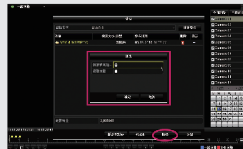
步驟3: 選擇備份影像檔案與撥放軟體, 點選備份