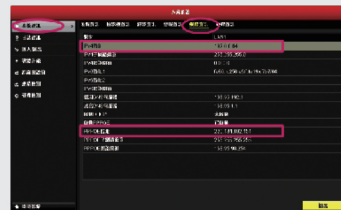
步驟5: 從系統維護中的系統資訊, 可以取得連線狀況與連線的IP位址