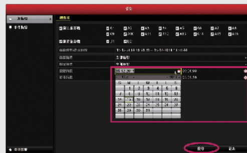
步驟2: 設定備份影像的開始與結束時間