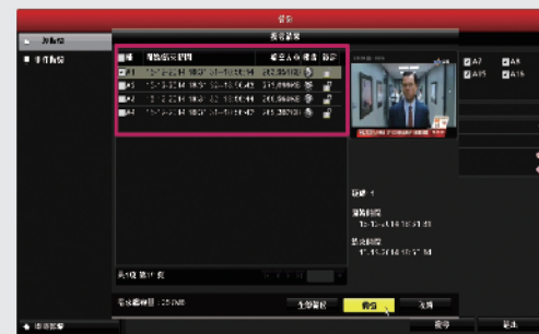
步驟3: 選擇影像檔案後開始備份