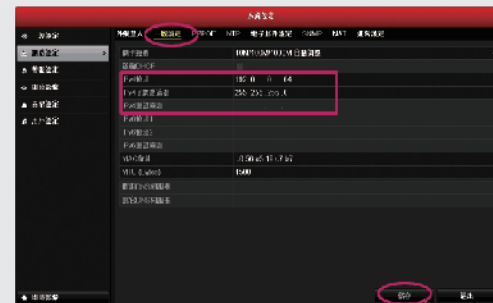
步驟3-1: 固定IP設定, 請輸入IP位址、子網路遮罩、預設閘道