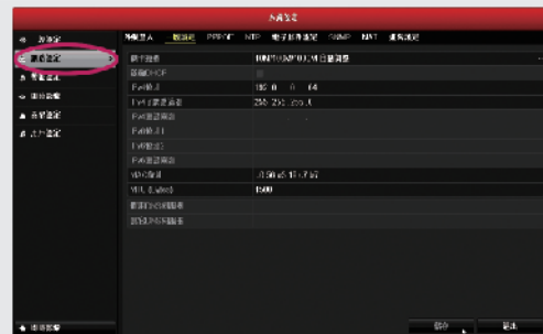
步驟2: 點選網路設定