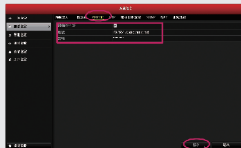
步驟4: 網路撥接, 輸入電信業者所提供的撥接帳號及密碼 (路由器撥接不需此設定)