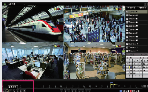
步驟1: 回放到要開始備份的影像, 點選開始剪輯、結束剪輯、最後保存剪輯