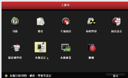
步驟1: 登入主選單後點選系統設定