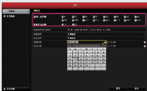
步驟1: 選擇要備份影像的頻道