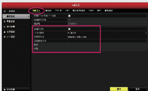
步驟3-2: 勾選啟動DDNS, 於設備網域名稱中輸入申請之帳號, 並至網站新增主機序號