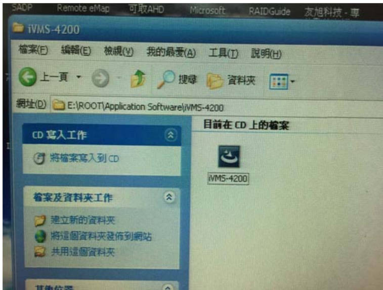
STEP3：於桌面上，雙擊點選 iVMS-4200 圖示