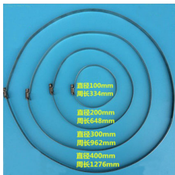
鐵環尺寸及示意圖