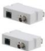
LR1002-1ET/1EC Single-port long reach ethernet over coax extender